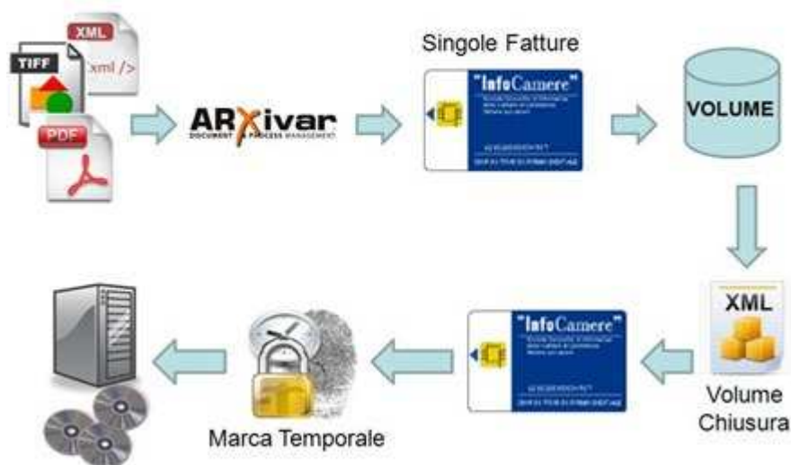
Figura 3: il processo evidenzia anche i passaggi di archiviazione, propedeutici e necessari

I documenti che possono essere dematerializzati non sono solo le fatture, che rappresentano la parte centrale del processo, ma anche gli altri documenti che sono parte dell'area commerciale (richiesta d'offerta, offerta, ordine e conferma d'ordine, etc.) oppure della parte logistica (prelievo, bolla allestimento consegna, DDT, spedizione). Relativamente alla DDT, si potrà portare in conservazione sia la copia originale, sia la copia di ritorno, con le firme di accettazione della consegna da parte del cliente, dopo opportuna scansione dell'immagine. Va comunque segnalato che la distruzione della copia firmata, della DDT, deve essere effettuata solo dopo l'effettivo pagamento dalla fornitura, in quanto in caso di opponibilità verso il cliente ed il giudice disponesse una perizia calligrafica e grafologica, questi obbligatoriamente devono essere effettuati sull'originale cartaceo.