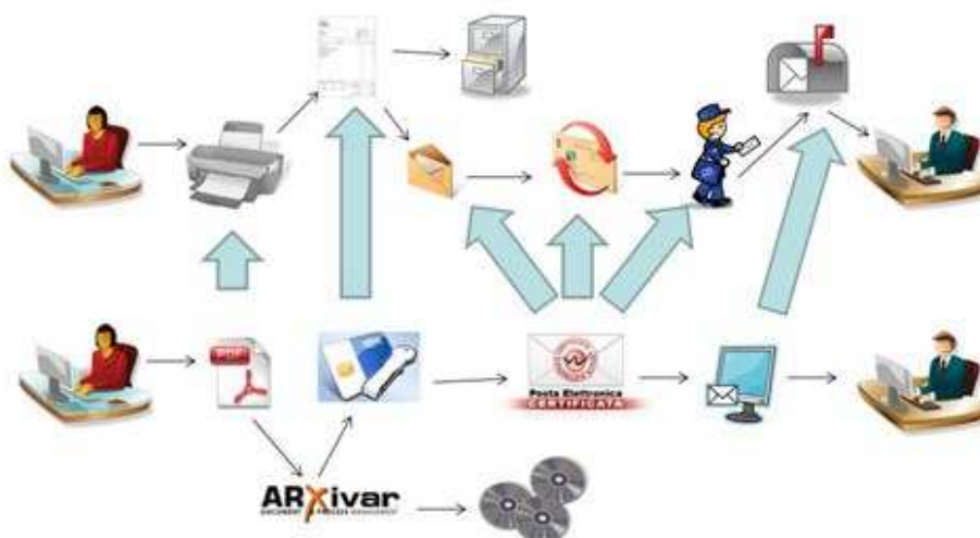
Figura 2: il cambiamento! - Le frecce grandi sono da intendersi come "sostituisce".