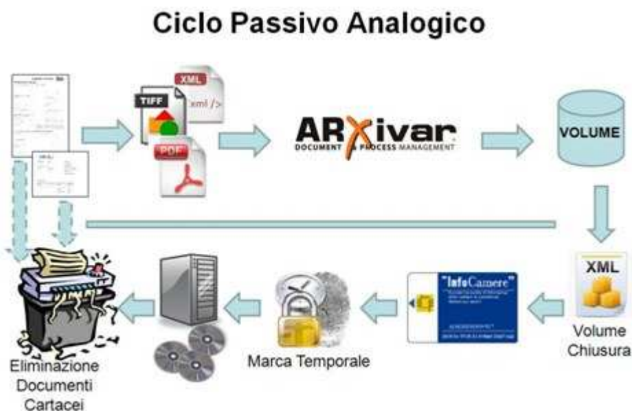
Figura 4: il processo evidenzia anche i passaggi necessari alla macerazione del volume cartaceo

Relativamente al ciclo passivo, si consiglia di mantenere l'archivio analogico (cartaceo) per l'intero periodo d'imposta e procedere alla generazione di un unico volume, firmato digitalmente e marcato temporalmente, per la conservazione sostitutiva di tutte le fatture ed eventualmente degli altri documenti del processo, quali, offerte, ordini, DDT, etc. Completato il processo di conservazione sostitutiva, si potrà procedere alla macerazione dell'intero volume cartaceo. Il processo si esplicita come di seguito: