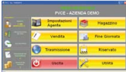
Videata del menu principale

NETBOOK EDITION: LA SOLUZIONE SOFTWARE PROFESSIONALE PER LA GESTIONE DELLA RACCOLTA ORDINI E PREVENDITA