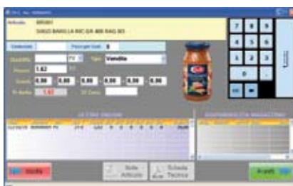
Videata dettaglio riga prodotto