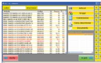
Videata ricerca prodotti