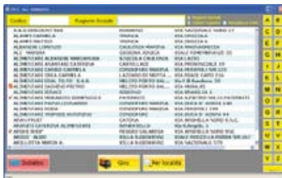
Videata ricerca clienti